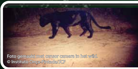
Foto gemaakt met censor camera in het wild.