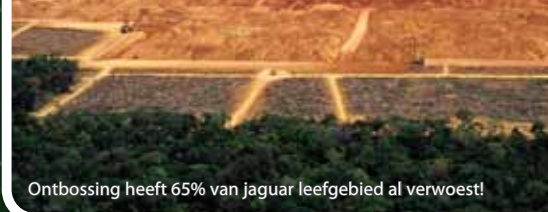
Ontbossing heeft 65% van jaguar leefgebied al verwoest!

Hoe? Door veeboeren te compenseren voor vee dat aangevallen is door jaguars om te voorkomen dat jaguarjagers ingehuurd worden.